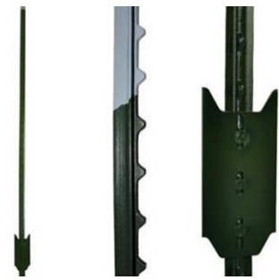
Figura 3: Poste Metálico